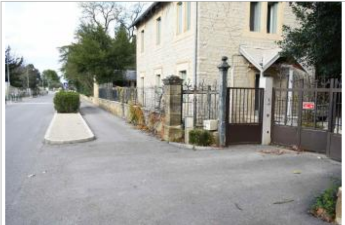
Vue d'ensemble du site. Repères sur le pilier du portail.

GÉOLOCALISATION Coordonnées WGS84 : X: 4.20689430 / Y: 43.68983800 Coordonnées RGF93 (Lambert 93) X: 797323.4 / Y: 6288610.9 Coordonnées RGF93 (ETRS89) : X: 4.2068943 / Y: 43.689838 Code Hydro: Y34-0400 Rive de référence: