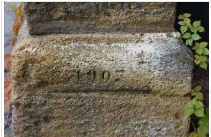
Photo rapproché du repère

MARQUE Texte : 1907 Maximum de l'inondation : Oui Visibilité : Oui État du repère : Bon