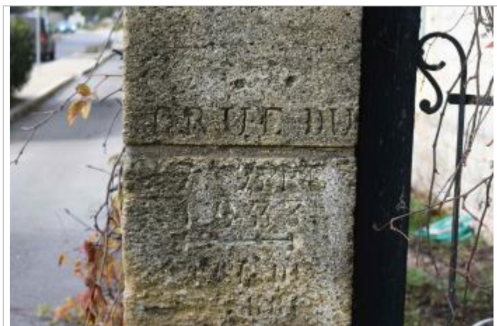
Photo rapproché du repère