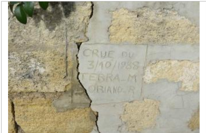
Photo rapproché du repère