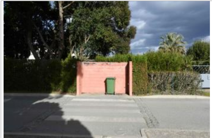
Vue d'ensemble du repère

GÉOLOCALISATION Coordonnées WGS84 : X: 4.20534970 / Y: 43.68300800 Coordonnées RGF93 (Lambert 93) X: 797210.44 / Y: 6287850.04 Coordonnées RGF93 (ETRS89) : X: 4.2053497 / Y: 43.683008 Code Hydro: Y34-0400 Rive de référence: