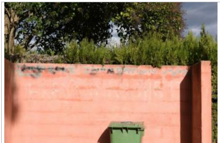
Photo rapproché du repère

MARQUE Texte : 1m80 2002 inondation 09/09 Maximum de l'inondation : Oui Visibilité : Oui État du repère : Mauvais Pérennité : Moyenne