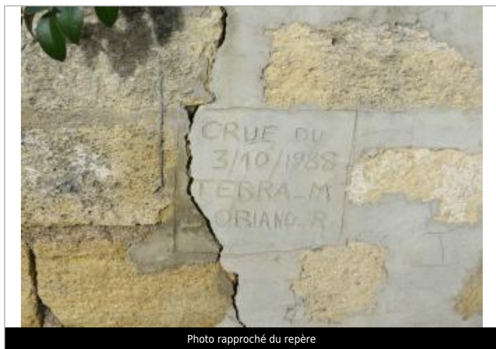
Photo rapproché du repère