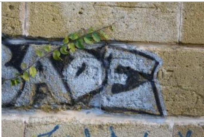
Photo rapproché du repère