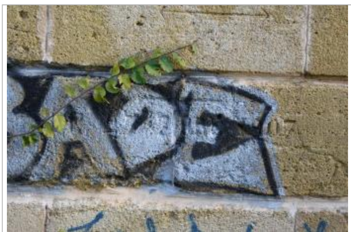
Photo rapproché du repère