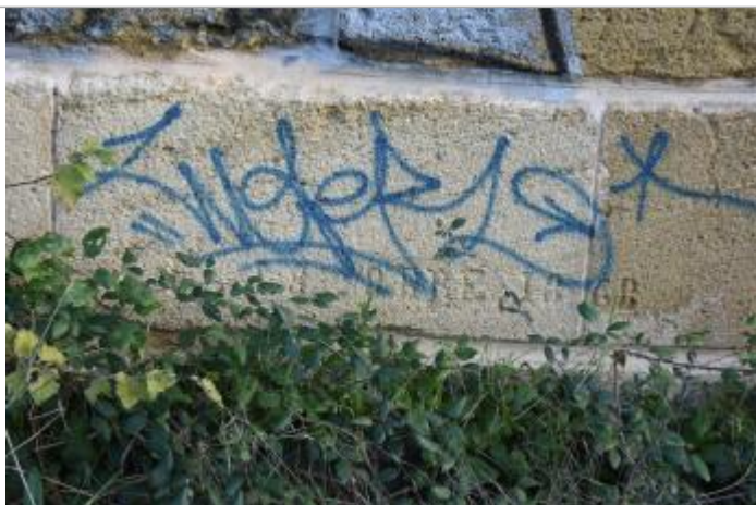
Photo rapproché du repère