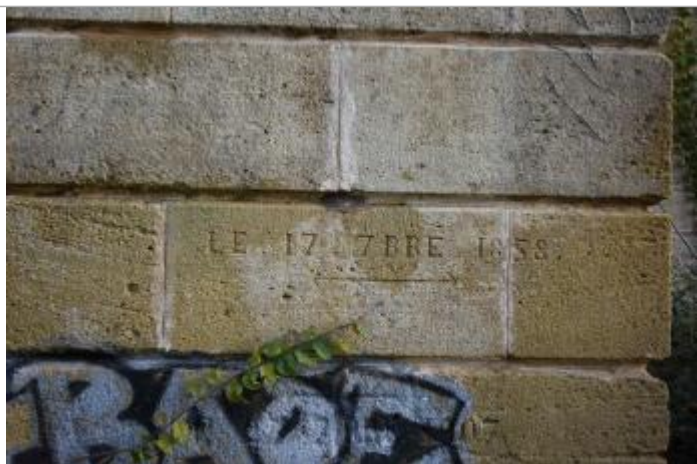
Photo rapproché du repère