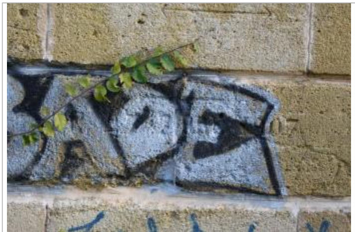
Photo rapproché du repère