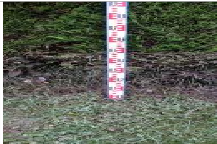
Vue d'ensemble du site, les repères sont au centre de la photo