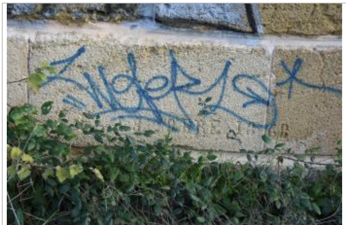
Photo rapproché du repère