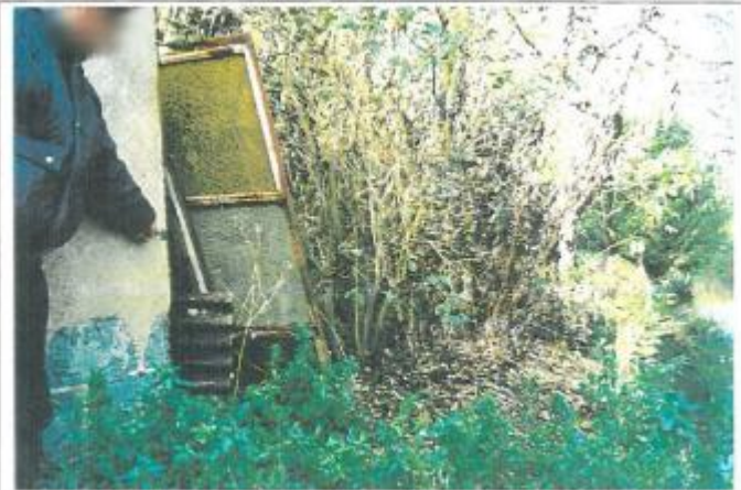
Site et repère de la crue de 1958