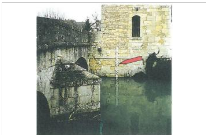
Repère (source : COMIREM)

Altitude calculée de l'eau (en m) : 128.06