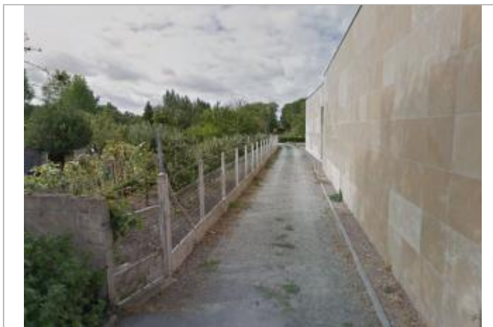
Site (source : Google Street View, septembre 2012)