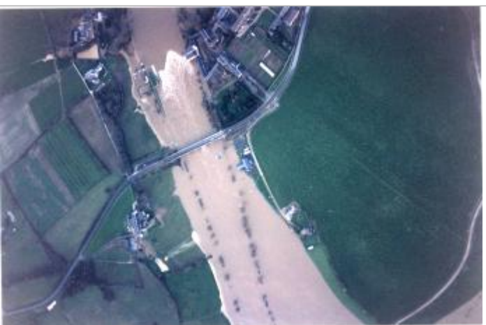
Vue de la crue

Code : 2018_MAY_R_102_1 Date de mise à jour : 16/12/2018 Auteur : SPC MLA