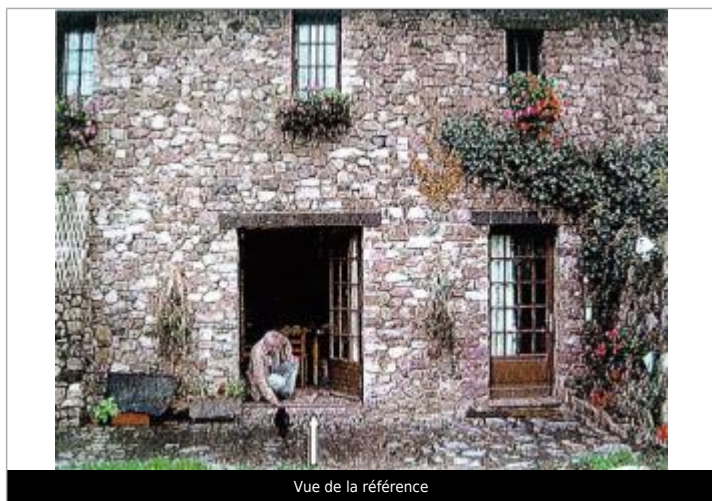
Vue de la référence