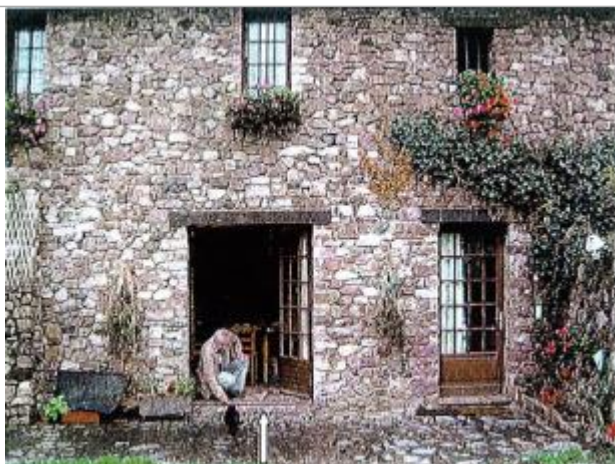
Vue de la référence