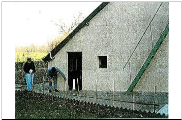
Vue de la référence

GÉNÉRAL Code : 2018_MAY_R_71_2 Date de mise à jour : Auteur : SPC MLA 07/12/2018