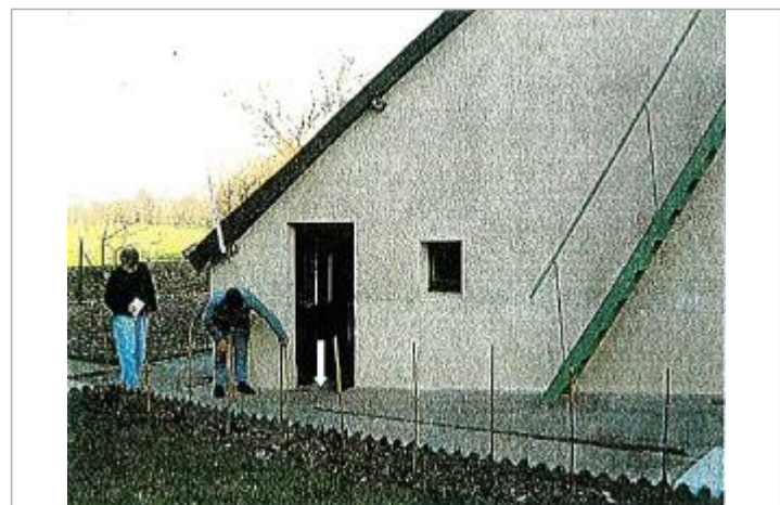
Vue de la référence

GÉNÉRAL Code : 2018_MAY_R_71_1 Date de mise à jour : 07/12/2018 Auteur : SPC MLA