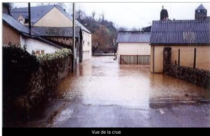
Vue de la crue