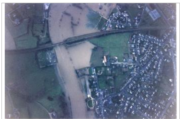
Vue de la crue

GÉNÉRAL Code : 2018_MAY_R_15_1 Date de mise à jour : 08/01/2019 Auteur : SPC MLA