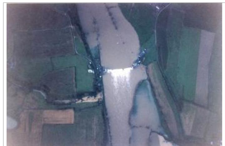
Vue de la crue

GÉNÉRAL Code : 2018_MAY_R_12_4 Date de mise à jour : 07/12/2018 Auteur : SPC MLA