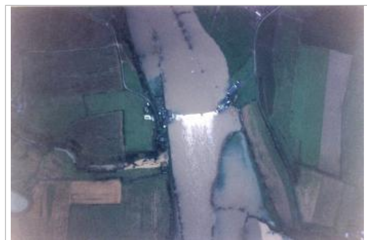
Vue de la crue