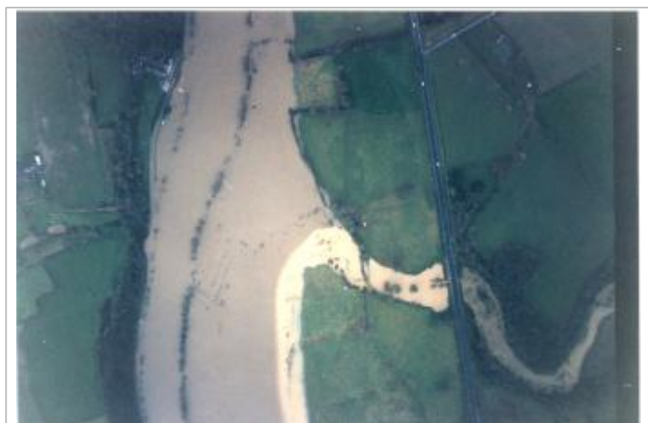
Vue de la crue

Code : 2018_MAY_R_140_1 Date de mise à jour : 07/12/2018