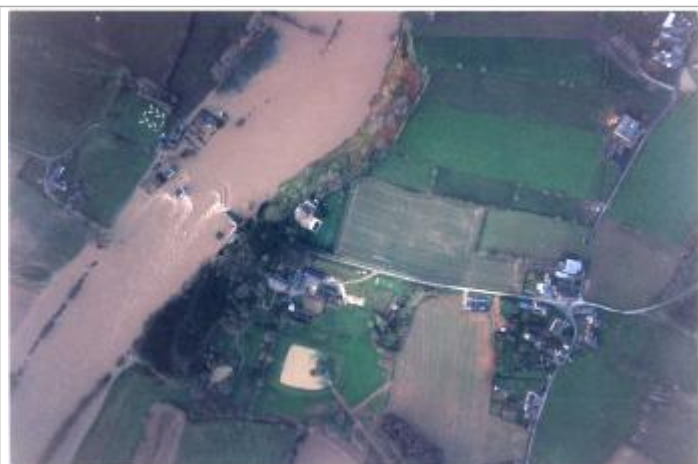
Vue de la crue

Altitude calculée de l'eau (en m) : 32.61