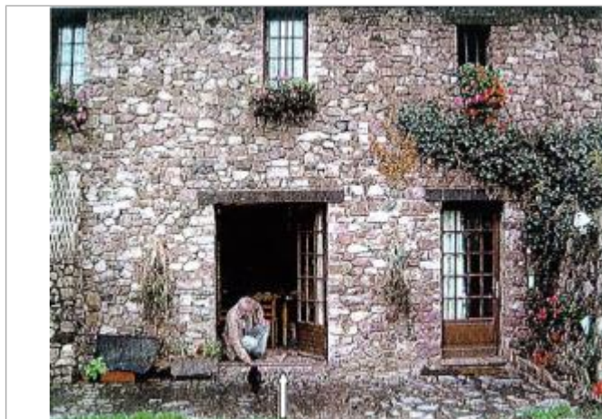
Vue de la référence