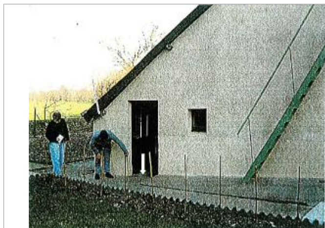
Vue de la référence