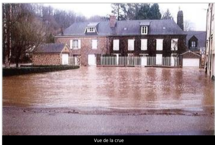
Vue de la crue