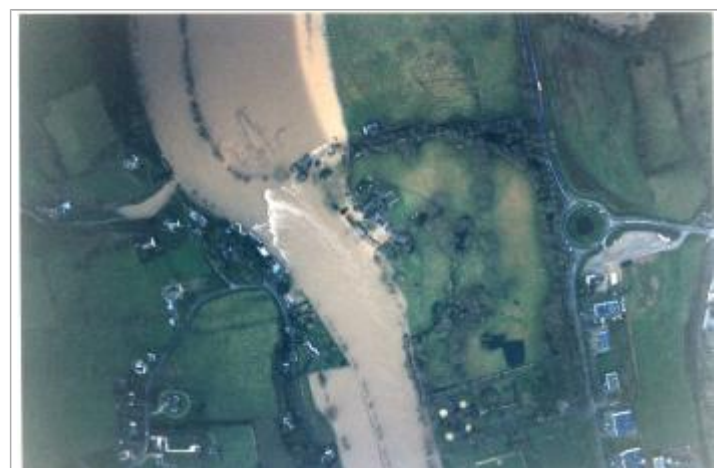
Vue de la crue

GÉNÉRAL Code : 2018_MAY_R_13_3 Date de mise à jour : Auteur : SPC MLA 08/01/2019