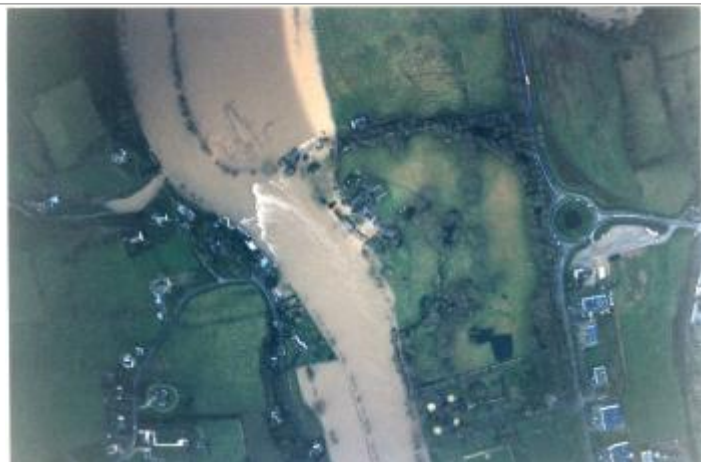
Vue de la crue