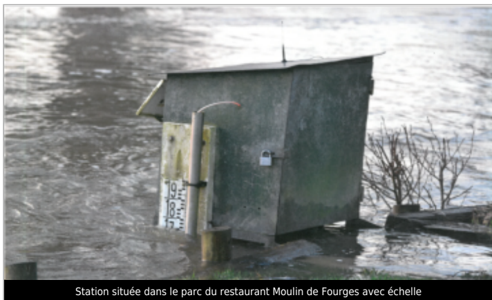
Station située dans le parc du restaurant Moulin de Fourges avec échelle