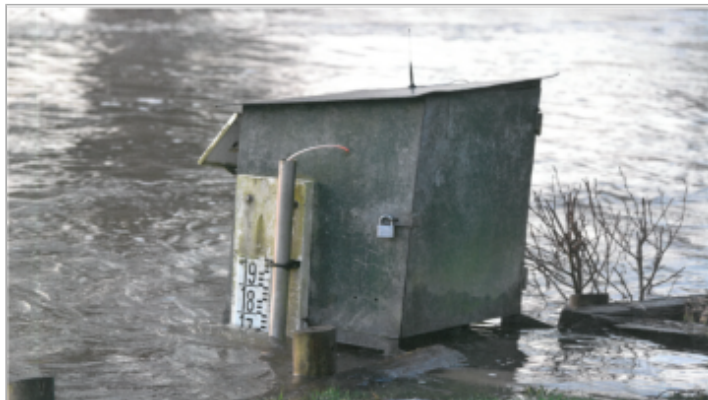
Station située dans le parc du restaurant Moulin de Fourges avec échelle