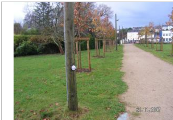
Allée Pierre Dornic