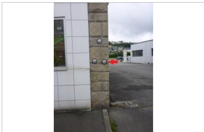
10, avenue des Sports à l'angle du bâtiment "Le Roux" - Crue de janvier 1995

Code : ODET_01_1995 Date de mise à jour : 27/06/2022