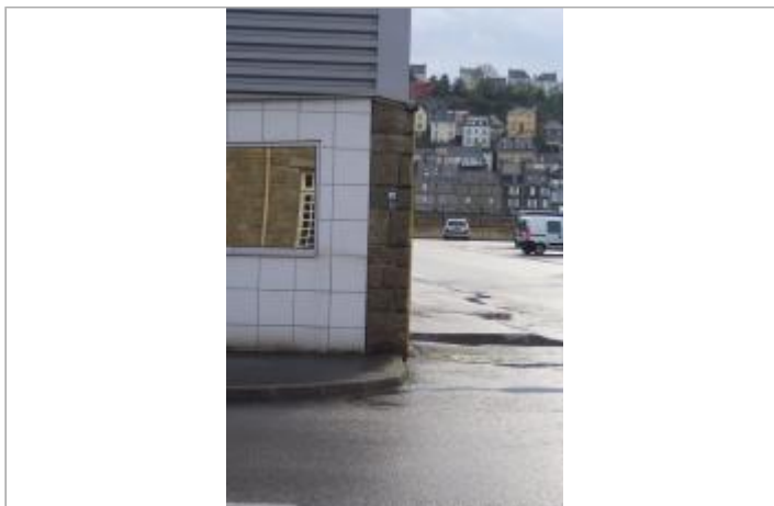
10, avenue des Sports à l'angle du bâtiment "Le Roux"