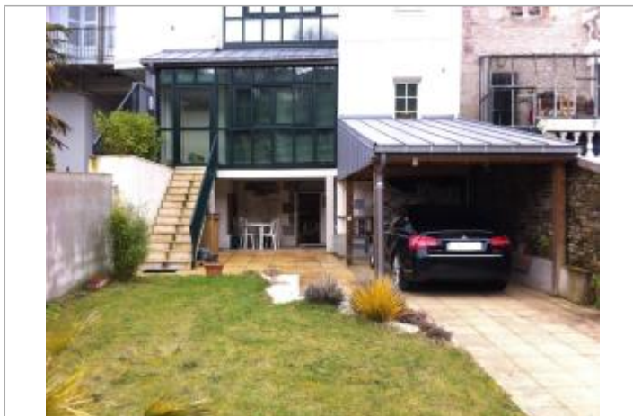
vue d'ensemble à l'arrière du bâtiment