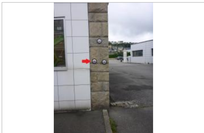
10, avenue des Sports à l'angle du bâtiment "Le Roux" - Crue de février 1974

Altitude calculée de l'eau (en m) : 6.46 m