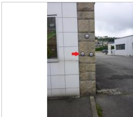
10, avenue des Sports à l'angle du bâtiment "Le Roux" - Crue de février 1974

Texte : Ville de Quimper - Inondation Février 1974 - Odet