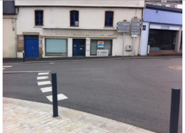
Rue de la Tour d'Auvergne