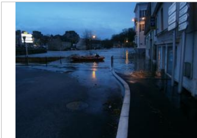
Laisse de crue rue de la Tour d'Auvergne au pic de la crue - source Mairie de Quimperlé

Altitude calculée de l'eau (en m) : 4.95 m