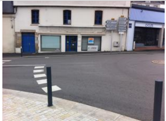
Rue de la Tour d'Auvergne