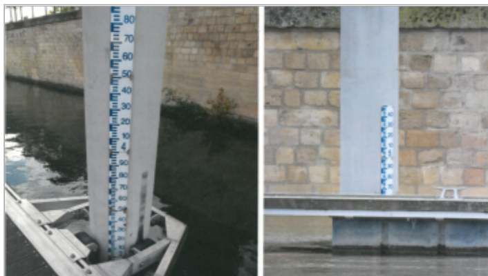
Echelle sur le quai mobile devant l'office de tourisme