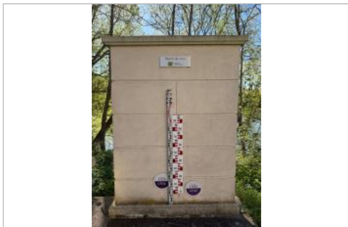
Vue de repères de crues