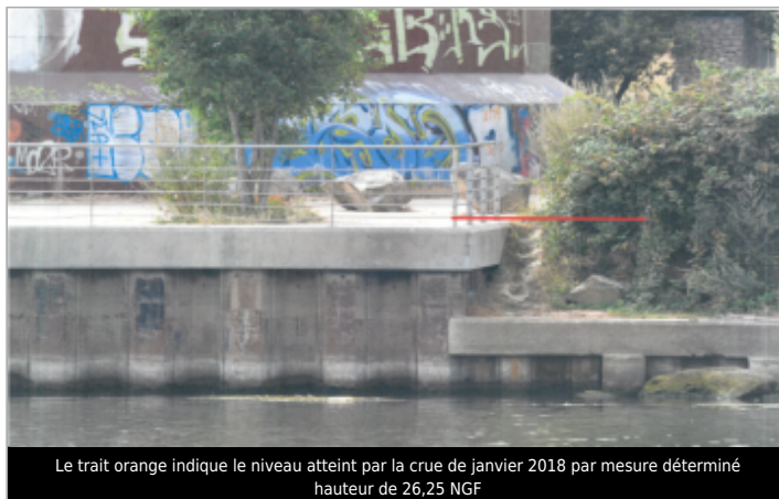
Le trait orange indique le niveau atteint par la crue de janvier 2018 par mesure déterminé hauteur de 26,25 NGF