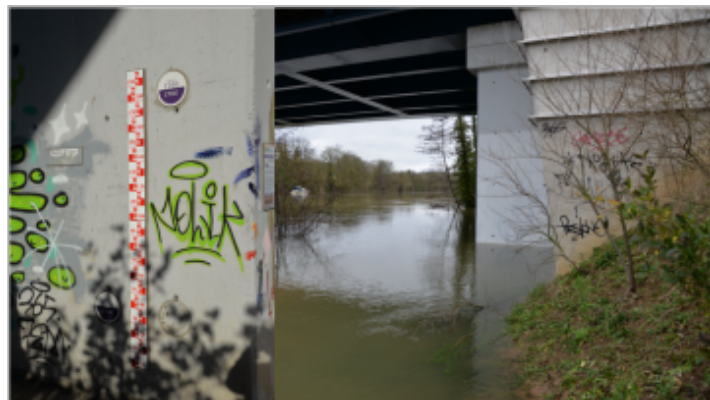
partie gauche photo échelle de crues partie droite pic de crue 2018