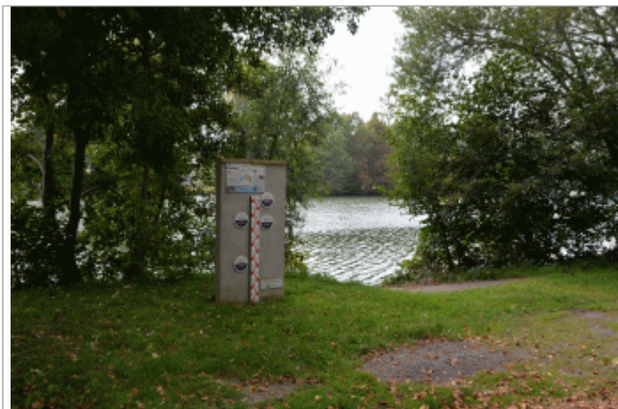
Repère de l'Entente Oise avec les principales crues en cote NGF