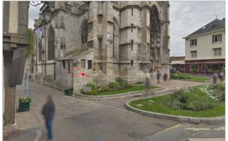
PILIER ANGLE DE LA RUE SAINT SAUVEUR - RUE CARNOT