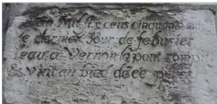
PILIER COLLEGIALE NOTRE DAME - ANGLE RUE SAINT SAUVEUR ET CARNOT

Texte : L'an 1658, ce dernier jour de février l'eau à Vernon, le pont rompit et vint au pied de ce pilier Maximum de l'inondation : Oui Visibilité : Oui État du repère : Moyen Pérennité : Longue