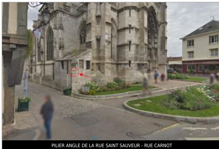
PILIER ANGLE DE LA RUE SAINT SAUVEUR - RUE CARNOT