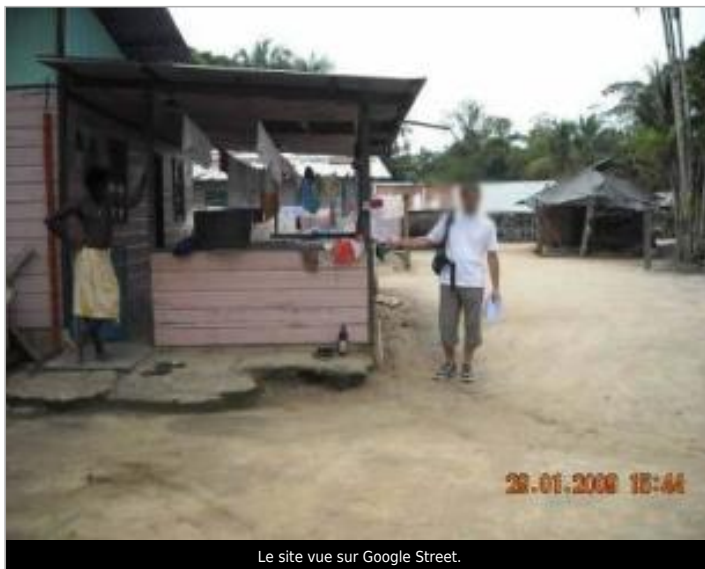
Le site vue sur Google Street.