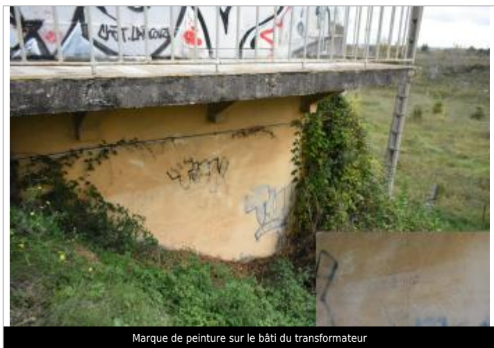
Marque de peinture sur le bâti du transformateur