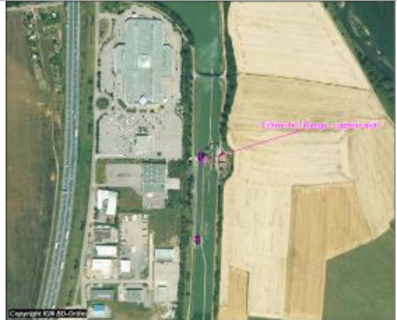
Plan de situation du capteur

Coordonnées WGS84 : X: 6.18320000 / Y: 49.22840000