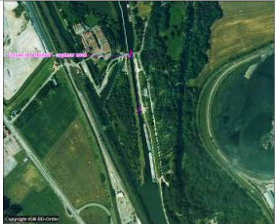
Plan de situation du capteur