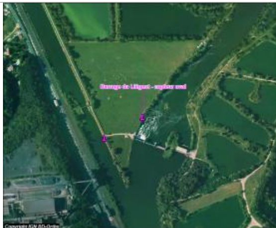
Plan de situation du capteur

Coordonnées WGS84 : X: 6.08244000 / Y: 48.83110000