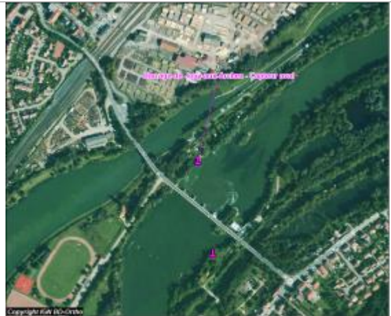
Plan de situation du capteur