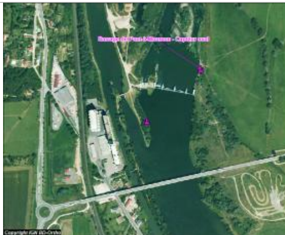
Plan de situation du capteur

Coordonnées WGS84 : X: 6.04498000 / Y: 48.92100000