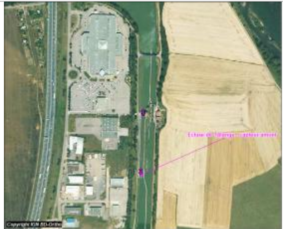
Plan de situation du capteur

Coordonnées WGS84 : X: 6.18299000 / Y: 49.22660000