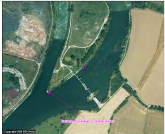
Plan de situation du capteur

Coordonnées WGS84 : X: 6.16788000 / Y: 49.31360000