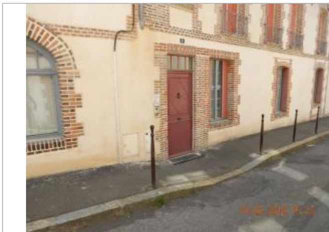
Porte d'entrée du 1 rue Désirée Marais